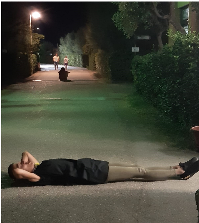
CREATURA DELLA NOTTE DELLA SPECIE "MADDALENA"