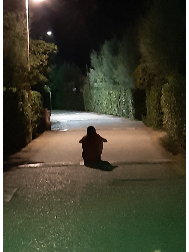
FATA DELLA NOTTE